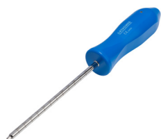
0010-C Tournevis pour vis métallique