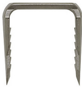
Agrafe d'arthrodèse pédiatrique