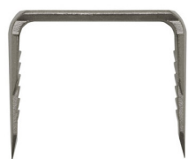
Agrafe d'arthrodèse adulte